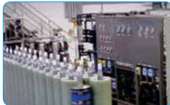
INDION® 板框式 (DT/PF) RO (反渗透) 系统*