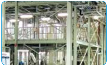
INDION ® 多效蒸发器 (MEE)

Ion Exchange (India) Ltd. 为工业部门、各机构和市政部门，提供一整套先进的环保产品、解决方案和服务。技术解决方案涵盖水体、液体、气体排放物、固体废物、生物固体和可再生能源，而服务内容包括咨询、交钥匙工程、O&M（运营维护）以及 BOOT（建设、拥有、运营、移交）项目。