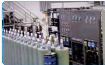
INDION ® 板框式 (DT/PF) RO (反渗透) 系统*