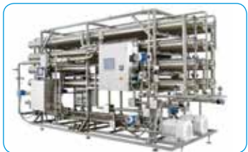
INDION ® 集成式染料脱盐、 水资源回收与ZLD (零排放) 系统