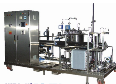
INDION® RO-EDI Systèmes