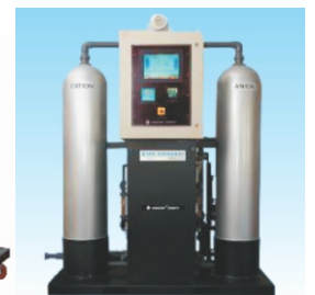
INDION® SWIFT Plus Déméralisateur