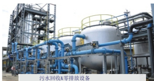
污水回收&零排放设备