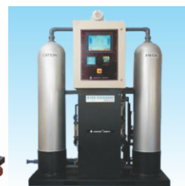
INDION® 超高速 去矿化器