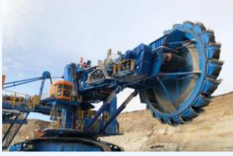
حفارة ذات مجرف دوراني

تعقب إدارة الخامات: يستعيد المياه بشكل فعال ويُطيل عمر مرفق تخزين المخلفات