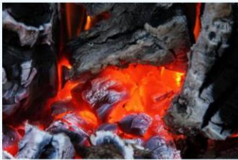
الرماد المتطاير من الفحم

مضادات الأكسدة: تقلل/تقضي على البقع الساخنة والاحتراق التلقائي في أثناء التخزين في ساحات المخزون من دون تدهور قيمة التدفئة الإجمالية (GHV) والقيمة الحرارية الإجمالية (GCV)