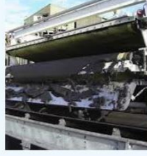
حزام الضغط لملاط الفحم