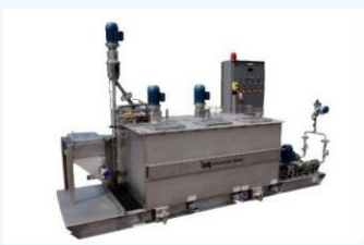
رغوة في عملية المعادن

التحكم في الرغوة: مجموعة من مزيلات الشحوم والعوامل المضادة للرغوة تساعد على تحسين الإنتاجية والربحية الإجمالية.