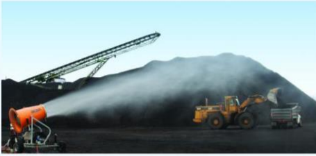
مشط الغبار على كومة الفحم

جامع ومُرِيد: يعزز الاستخراج ويقفل من ترحيل الزبد إلى المصب