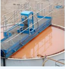
مكتف خام الحديد

التطبيقات في التعدين من أجل تحسين الكفاءة والإنتاجية: الفحم والحديد والزنك والنيكل وما إلى ذلك.