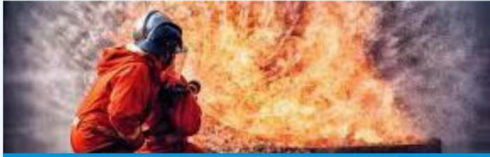
(AO) دون التوقف اليدوي للحريق في منطقة العمل

مساعدة تدفق الفحم للفحم الرطب في المحطات المشتركة لتوليد الكهرباء والحرارة (CHP): يحسن تدفق الفحم المستمر إلى المخابئ خلال موسم الأمطار.