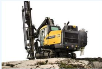
مادة مضافة لوقود الديزل لمعدات الأرض الثقيلة المتحركة

إضافات الوقود: ديزل، الثِّقْل، فحم وزيت فرن لتحسين الأميال /والأداء للوقود، ولصيانة أقل ومحرك أنظف وصحي