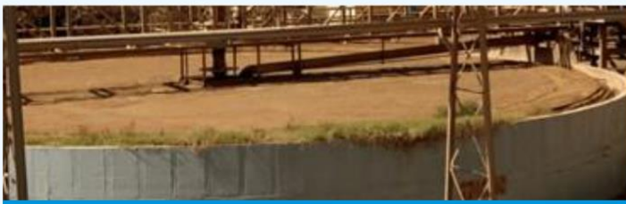
광물 공정의 포말

연료 첨가제: 디젤, 사탕수수, 석탄 및 용광로 오일은 더 나은 연비/성능, 적은 유지보수 및 더 깨끗하고 좋은 엔진을 위한 것입니다.