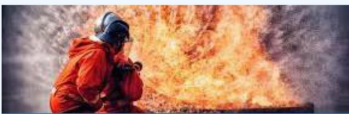
AO 없음 - 수동 화재 중지

의 습탄용 석탄 흐름 보조제: 장마철 동안 벙커로의 석탄 흐름이 중단되지 않도록 개선합니다.