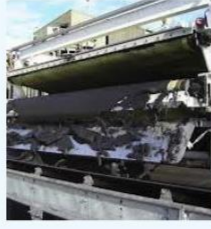
석탄 슬러리용 벨트 프레스