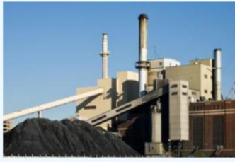
석탄 손실 - 자유로운 이동

의 습탄용 석탄 흐름 보조제: 장마철 동안 벙커로의 석탄 흐름이 중단되지 않도록 개선합니다.