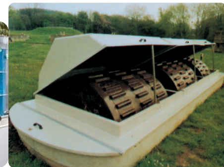
INDION新一代袋式污水处理装置 (NGPSTP)