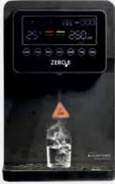
إشعال التناضح العكسي الساخن والعادي