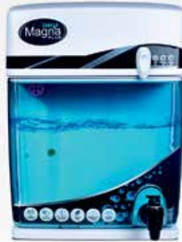
ماغنا بلاس RO+UV+UF