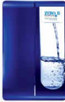
رفيق المطبخ RO (تحت الحوض)