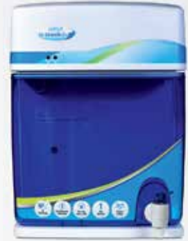
بالأشعة فوق البنفسجية