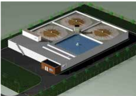
المفاعل الدفعي المتسلسل من ان ديون