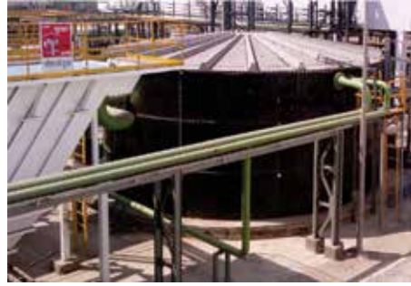
مفاعل الوسائط المميعة مفاعل حيوي متحرك