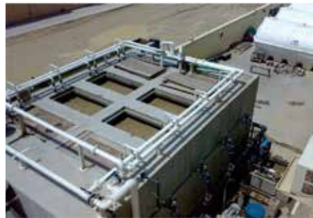
المفاعل الحيوي الغشائي من ان ديون