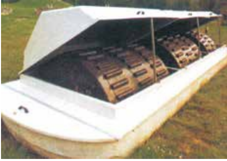
محطة معالجة مياه الصرف الصحي المعبأة من الجيل الجديد