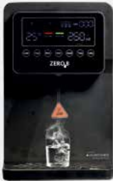
Ignite Hot & Normal RO