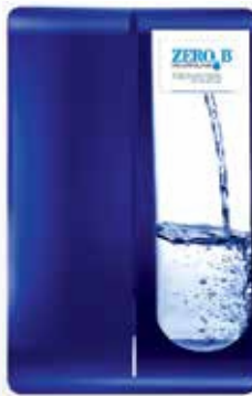
Kitchenmate RO(싱크대 밑)