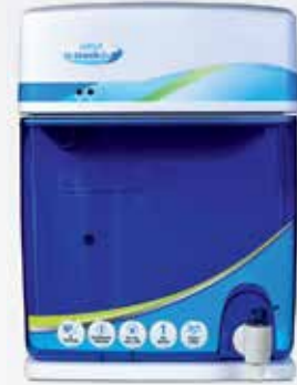
UV Grande 2X UV+UF