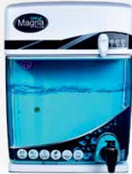
Magna Plus RO+UV+UF