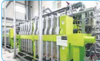
الديزلة بالكهرباء الانعكاس (EDR)