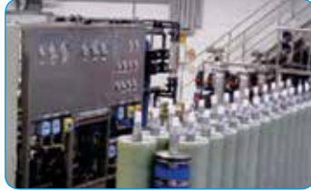
INDION® نظام التناضح العكسي إطار اللوحة (DT/) *(PF)

تقدم شركة التبادل الأيوني (الهند) المحدودة مجموعة كاملة من المنتجات والحلول والخدمات البيئية المتقدمة للقطاعات الصناعية والمؤسسات والبلديات. وتعد المياه والنفايات السائلة والغازية السائلة والنفايات الصلبة والمواد الصلبة الحيوية والطاقة المتجددة من بين الحلول التقنية المقدمة، في حين تشمل الخدمات الاستشارات والمقاولات الجاهزة ومشاريع التشغيل والصيانة والتمهيد والتشغيل.