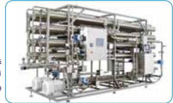
INDION® نظام متكامل لتحلية الأصباغ واستعادة المياه ونظام ZLD

مرافق التصنيع الحديثة لدينا حاصلة على شهادات ISO 9001، ISO 14001، ISO 45001