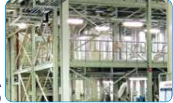
INDION® متعدد التأثير المبخر (MEE)