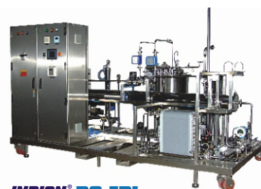
INDION® RO-EDI 系统