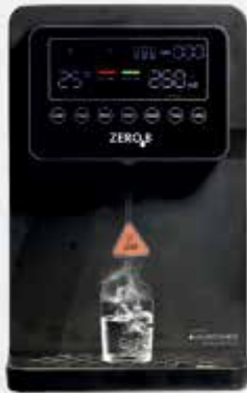
ホット&ノーマルROに着火