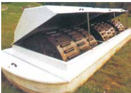
INDION 新世代パッケージ / 汚水処理プラント (NGPSTP)