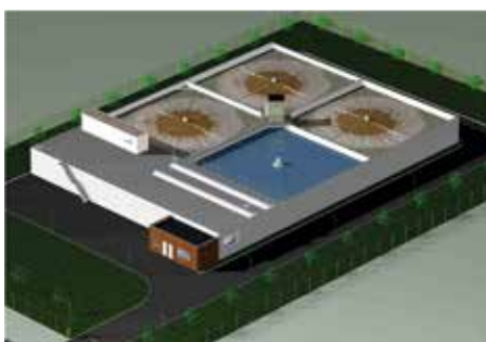
INDION シーケンスバッチリアクター (SBR)