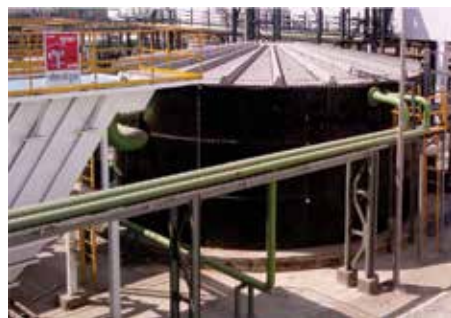
INDION フェイデッドメディアリアクター (FMR) / INDION 移動床バイオフィルム反応器 (MBBR)