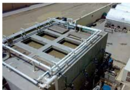
INDION 膜バイオリアクター (MBR)