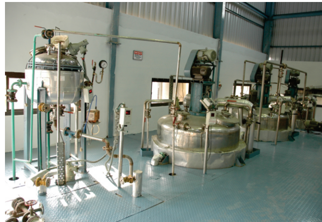
经过验证的制造工艺流程图 INDBOND 粘合剂和 INDION ® 分散剂

在保证客户满意度的条件下，我们提供工艺化学品- INDBOND 粘合剂和 INDION 分散剂、水/废水处理和回收以及零液排放解决方案，以改善瓷砖的制造工艺和质量。为了满足日益增长的需求，我们在古吉拉特邦莫尔比开设了一家制造厂。